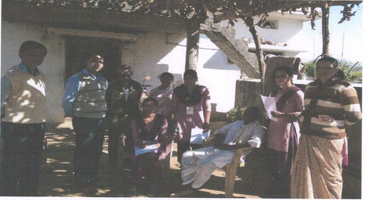
दत्तक ग्राम कासवी येथे विद्यार्थी भाषा आणि साहित्य सर्वेक्षण करताना

कासवी हे गाव महाविद्यालयाने दत्तक घेतले. या गावातील बोलींचा अभ्यास व साहित्यिक अभिरूचीचा अभ्यास करण्यात आला. या अभ्यासादरम्यान साहित्य व बोलीविषयक विविध वैशिष्ट्ये लक्षात आली. प्रामुख्याने त्या त्या समाजाच्या व जातीच्या बोलीभाषा आढळून आल्या. तथापि सर्वकषपणे या बोलीभाषांचा मुलाधार झाडीबोली आहे. झाडीबोलीच्या परिप्रेक्षात इतर बोलीभाषा बोलल्या जातात, हे निष्कर्ष हाती येते. गावातील विविध बोलींचे स्वरूप खालीलप्रमाणे आहे.