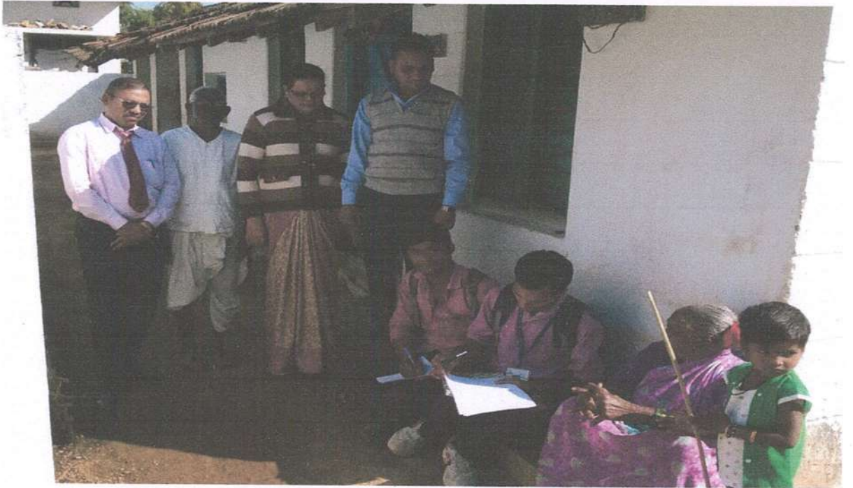
दत्तक ग्राम कासवी येथे विद्यार्थी भाषा आणि साहित्य सर्वेक्षण करताना